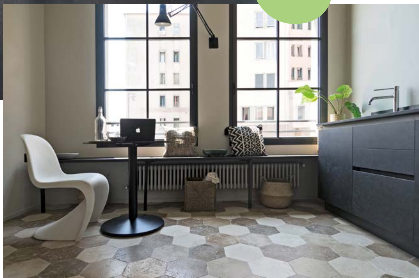
Per rendere attraenti questi due monolocali sui Colli Euganei, nel Veneto, si è puntato su arredi di design riconoscibili, come la Panton Chair nella foto qui sopra, abbinati al pavimento in cementine già esistente.